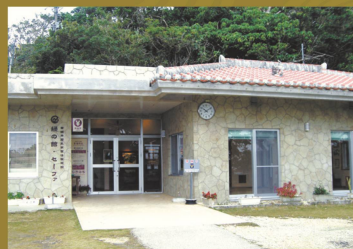
緑の館・セーフア